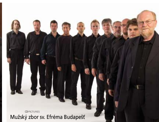
Mužský zbor sv. Efréma Budapešť