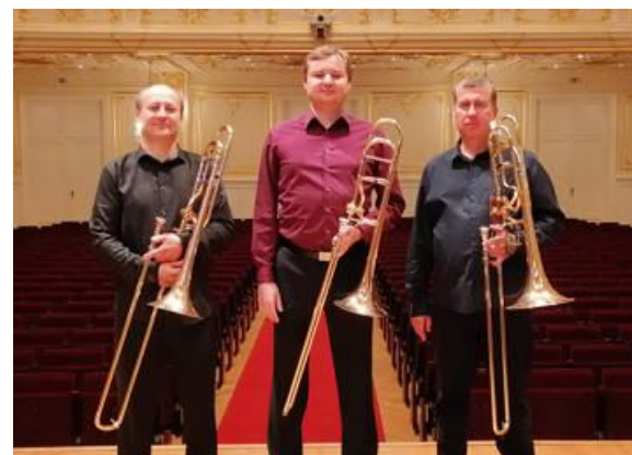
BRATISLAVSKÉ TROMBÓNOVÉ TRIO