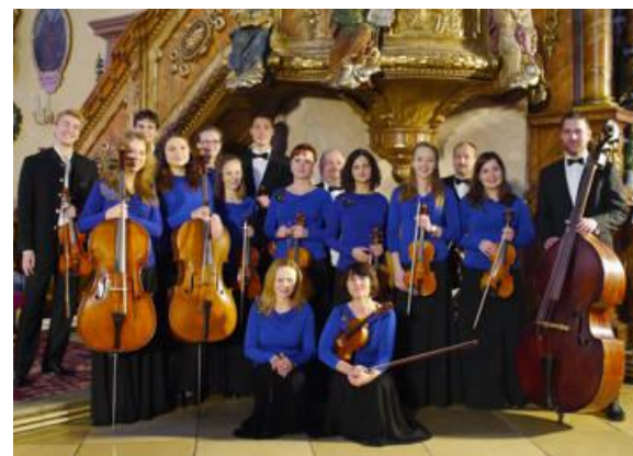
TRNAVSKÝ KOMORNÝ ORCHESTER